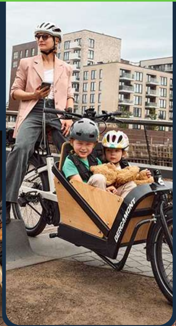
Vélos cargos et utilitaires