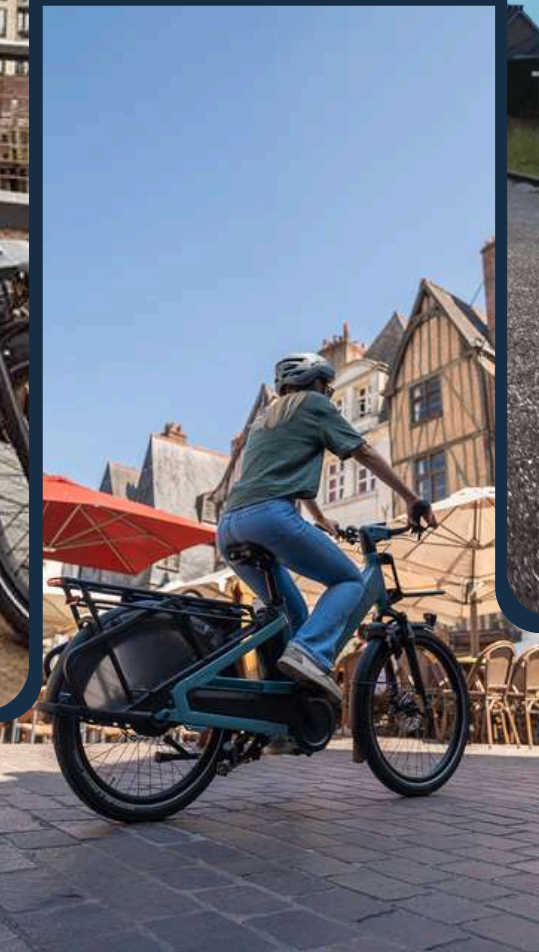
Vélos urbain, VAE ou non